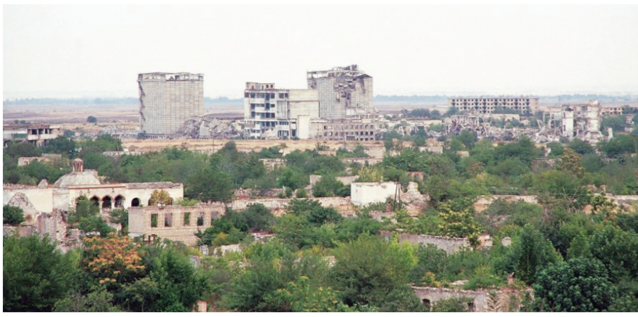
Agdam rayonunun Ermənistan silahlı qüvvələri tərəfindən işğalından 26 il keçir.

1993-cü ilin iyun-iyul aylarında Gəncədə və Bakıda baş verən hadisələr ermənilərə Qarabağ cəbhəsində hücum əməliyyatlarını genişləndirmək imkanı verdi. Ağdamın müdafiəsini həyata keçirən yerli özünümüdafiə batalyonları erməni silahlı birləşmələri ilə qanlı döyüşlərə girdi. Ancaq heç bir kömək almayan batalyonların döyüşçüləri iyulun 23-də geri çəkilməyə məcbur oldular. Bununla da 43 gün düşmənin sinə görmüş Ağdam şəhəri süqut etdi. İşğalçı erməni silahlı birləşmələri evlərə od vurdu, mədəniyyət abidələrini dağıtdı, insanların əmlaklarını qarət etdi, şəhəri tərk edə bilməyən dinc əhaliyə amansız divan tutdu. Ağdam rayonunun 1094 kvadratkilometrlük ərazisinin 882 kvadratkilometri zəbt edildi, 128 min nəfər doğma ev-əşiyindən didərgin düşdü. İşğal nəticəsində 122 kənd, 24 min 446 yaşayış binası, 48 sənaye və tikinti müəssisəsi, 160 məktəb binası, 65 səhiyyə mərkəzi, 373 mədəniyyət ocağı, 1 teatr, 3 məscid və 2 muzey yandırılıb məhv edildi. Erməni terrorçuları Ağdamın işğal zamanı ağır hərbi cinayətlər törətdilər. Ağdam Qarabağ müharibəsində ən