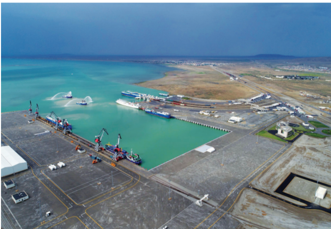
Bu ilin yanvar-iyun aylarında Bakı Limanından daşınan TIR-ların sayı 57,8 faiz artıb.

"Bakı Beynəlxalq Dəniz Ticarət Limanı" QSC-dən bildirilib ki, 6 ayda Ölət qəsəbəsindəki yeni Bakı Limanında ümumi yük, vaqon, TIR və konteyner aşırmaqları, eyni zamanda, səmişin daşınması üzrə müsbət göstəricilər qeydə alınıb. Uğurlu ya-